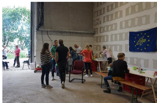
Gemeinsames Grillen an der Pilotanlage (Juni)