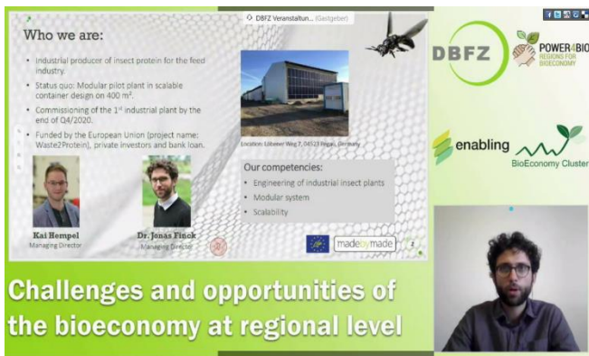
Möglichkeiten der Bioökonomie in Sachsen (Juni)