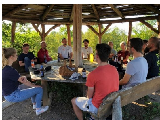
Strategie-Workshop mit dem gesamten Team (September)