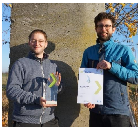
KfW Preis für Sachsen gewonnen (Dezember)