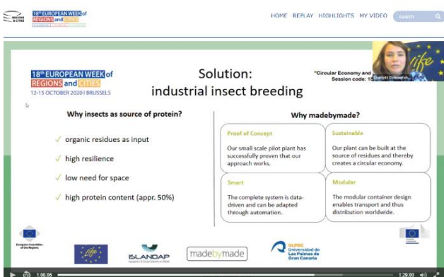
EU Week of City and Regions (Oktober)