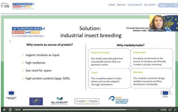
EU Week of City and Regions (Oktober)