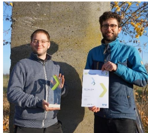
KfW Preis für Sachsen gewonnen (Dezember)