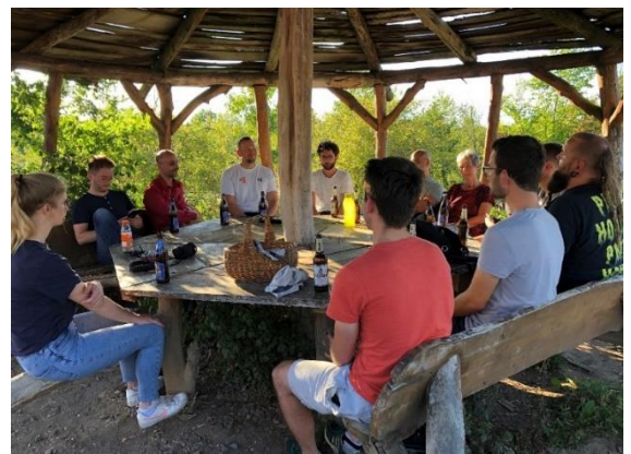
Strategie-Workshop mit dem gesamten Team (September)