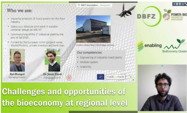
Möglichkeiten der Bioökonomie in Sachsen (Juni)