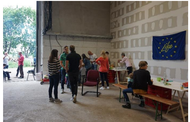
Gemeinsames Grillen an der Pilotanlage (Juni)