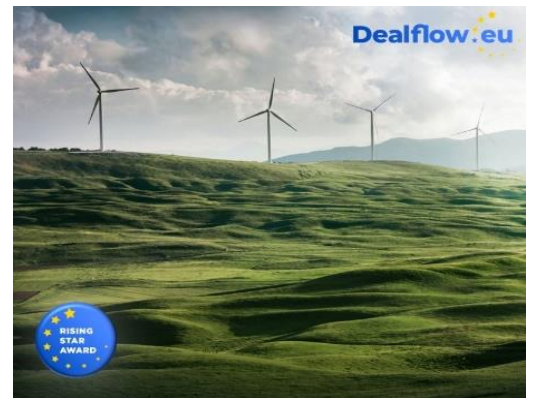
Online Pitch "Most innovative Sustainability Start up" von EU Dealflow (Mai)