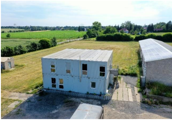
Umzug zum neuen Standort Nahe der Anlage (Januar)