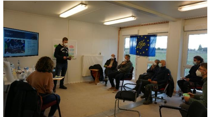
Interner LEAN Management Workshop (März)