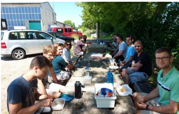
Gemeinsame Mittagspause an neuer Mittagsecke (Juni)