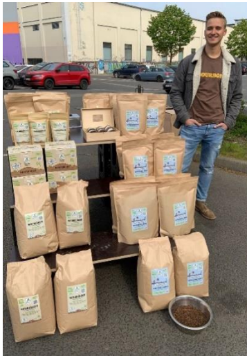
Samstagmarkt Plagwitz (April)