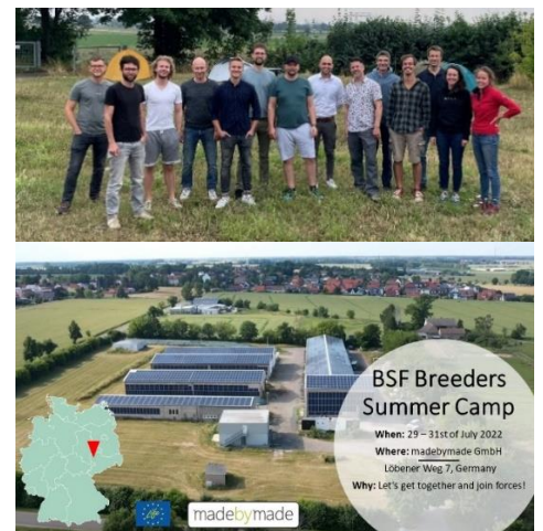
BSF Breeders Summer Camp (Juli)