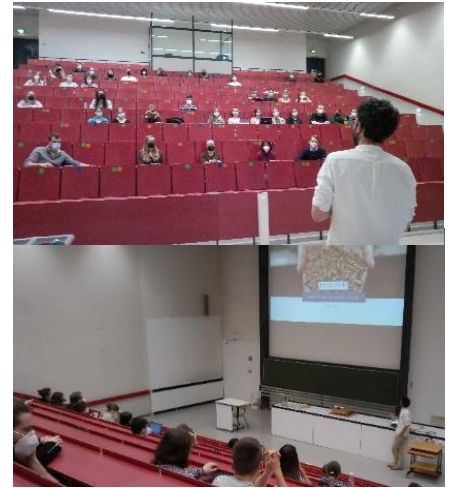
Waste2Protein Vortrag Uni Giessen (April)