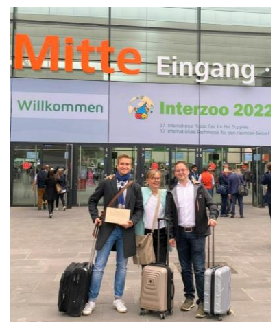
Interzoo Messe (Mai)