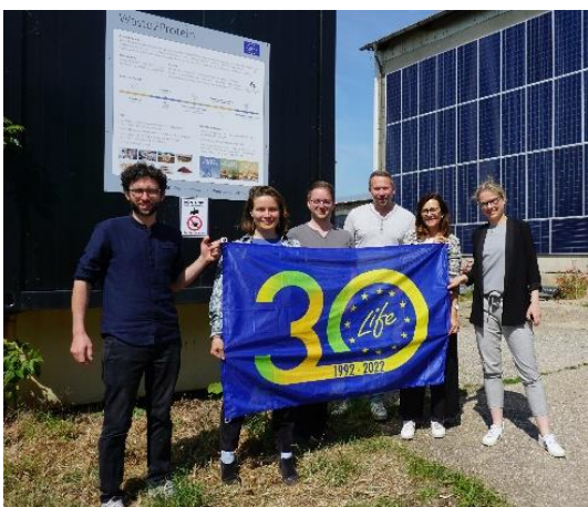
Besuch LIFE Koordinatorinnen bei uns (Juni)